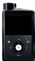
Bomba de insulina MiniMed™ serie 600 1